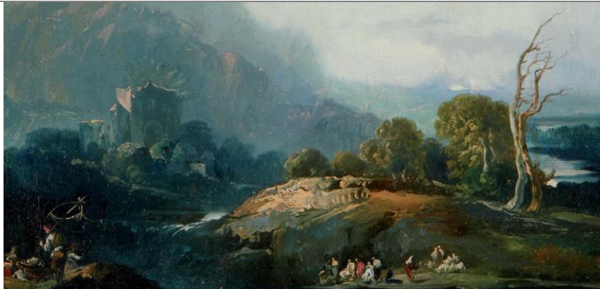
Detalle "Paisaje con pescadores". Eugenio Lucas Velázquez

Eugenio Lucas Velázquez. Eugenio Lucas Villamil. Colección Lázaro SEGOVIA- 27 Junio- 24 noviembre 2012 PRIMERA MONOGRAFÍA DEL PINTOR EUGENIO LUCAS VELAZQUEZ